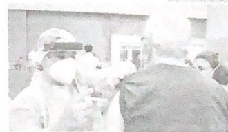
A intenção da campanha é optar primeiro pelos mais passíveis de terem complicações ocasionadas pela doença.

de Fortaleza. "Nós tínhamos em torno de 25 a 30% das interações compostas por pessoas acima de 75 anos. Em março, estamos entre 15 e 16%. Ou seja, a vacinação já está impactando e reduzindo os índices de hospitalização pela doença. A gente espera que venha a impactar, também, a mortalidade", afirma. Centros de vacinação A exemplo da etapa anterior, a imunização vem ocorrendo de forma descentralizada em oito centros de vacinação, evitando aglomeração e respeitando as regras sanitárias. Os endereços estão localizados na Arma Castela, no Centro de Eventos no shopping Riobar Fortaleza e no Riobar Kennedy. Além do drive-thru, estão disponíveis pontos de acolhimento para vacinação para atender tanto os idosos que dispõem de carro como os que utilizam outros meios de transporte. Já os quatro Cucas (Barra do Ceará, Jaguaruá, Mon-